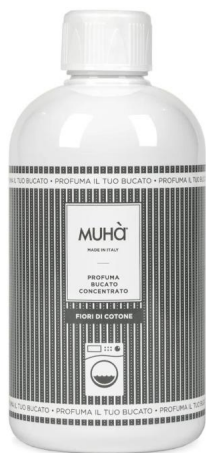
Muhà Profuma Bucato Fiori di Cotone 400ml - Profumatore per Lavatrice Profumatori