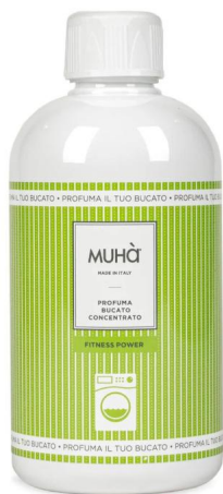
Muhà Profuma Bucato Fitness Power 400ml - Profumatore per Lavatrice Profumatori