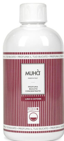
Muhà Profuma Bucato Lino e Cotone 400ml - Profumatore per Lavatrice Profumatori