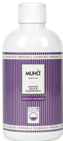
Muhà Profuma Bucato Soffio di Provenza 400ml - Profumatore per Lavatrice