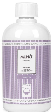
Muhà Profuma Bucato Violetta 400ml - Profumatore per Lavatrice Profumatori per