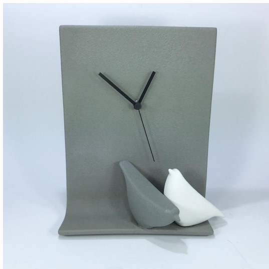
Orologio moderno con uccellini Lineasette ceramiche Orologi da parete e Appoggio